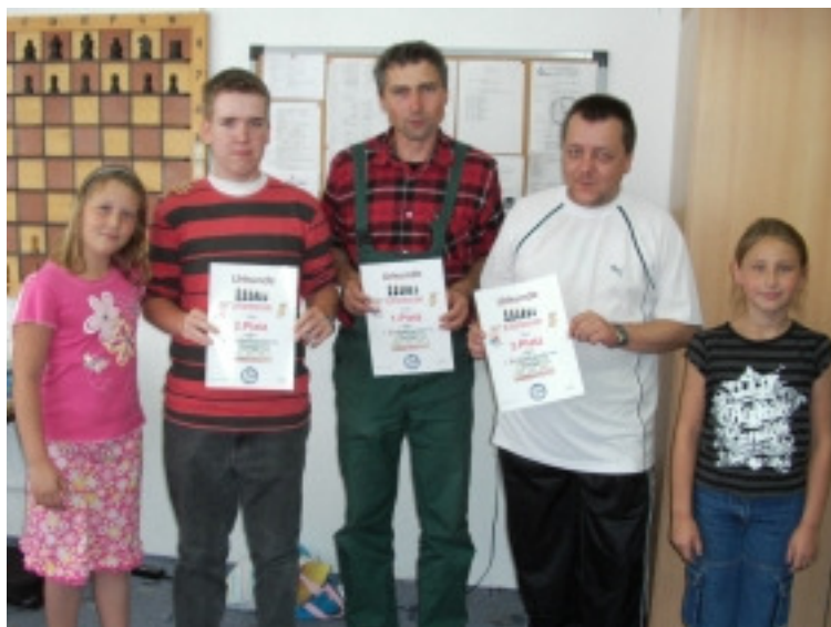
Die ersten Drei gerahmt von den Girls