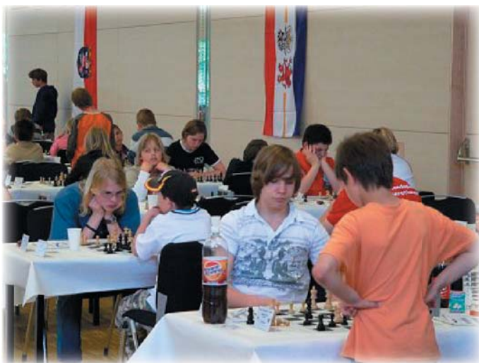
Ausblick in den Turnierbereich der ODEM 2007

Die Besonderheit der Offenen Deutschen Einzelmeisterschaft u25 ist die 3-Punkte-Regel, welche mir sehr sinnvoll erscheint. Oft treffen wir im Schachalltag auf Kurzremisen und das auch schon im Jugendbereich. Dadurch, dass es drei Punkte für einen Sieg und nur einen für ein Remis gibt, wird kampfbetontes Schachspiel belohnt und vor allem gefördert. Bisher konnte ich zwar nicht von dieser Regel profitieren, denn leider kann auch ein über sechs Stunden erkämpftes Remis wie eine Niederlage wirken, die Idee hingegen gefällt mir trotzdem sehr gut.