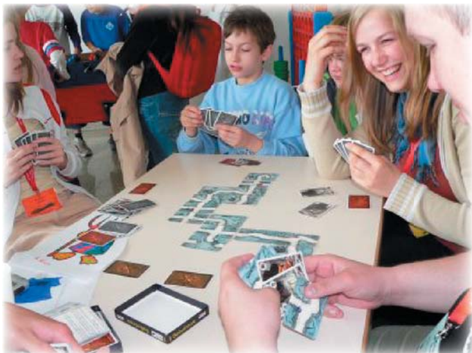
Gruppenpaß ist beim Spiel Saboteur garantiert