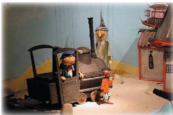
Die Mannschaft aus dem Lummerland ist am Zug