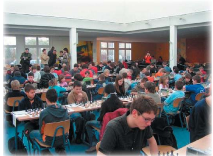
Ein Eindruck von der Landeseinzelmeisterschaft 2007 in Mecklenburg-Vorpommern

Wie gut Ihr über unser Bundesland Bescheid wisst, könnt Ihr in unserem Länderquiz beweisen. Das Quiz findet Ihr auf dem letzten Blatt dieser Zeitung. Unter allen Knoblern verlosen wir einen attraktiven Hauptpreis. Gebt bitte Eure Lösungen am M-V-Stand ab.