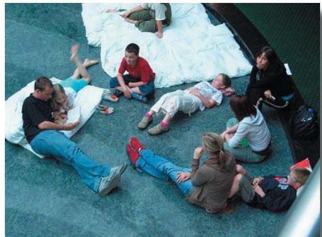
Ein gemütlicher Tagesausklang? Kein Problem für die Freizeitkommissare. Im Atrium des Hotels werden die Gute-Nacht-Geschichten vorgelesen.