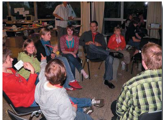
Gestern Abend, Tatort Freizeitkommissariat: Wie erwartet kam eine große Runde zum „Werwolf-Spiel“ zusammen.