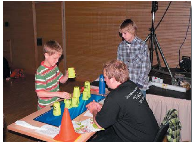
Das neue Trendspiel: Speed-Stacking war gestern auch eine Disziplin bei der Räuber-Olympiade.

Lösungen bitte im Freizeitkommissariat abgeben! Als Belohnung gibt es eine Bremer-Süßigkeiten-Spezialität.