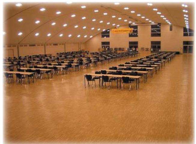
Durch den Länderpunktausgleich könnte es im Turniersaal bald so aussehen: Leere Tische und Stühle, wohin man schaut. Das alte und aufwändige Verfahren der Punktverteilung durch Schachpartien könnte dann der Vergangenheit angehören.