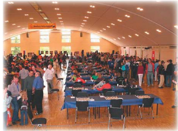
Turniersaal der DEM - Zustand: Voll

Dieses Fazit und vor allem die große Zustimmung durch die Spieler selbst haben uns dazu bewogen, auch in diesem Jahr wieder eine Runde für Betreuer und Eltern zu sperren. Deshalb wird gleich am Sonntag die zweite Runde „kiebitzfrei“. Parallel laden wir alle Eltern und Betreuer zu einem Elternforum ein.