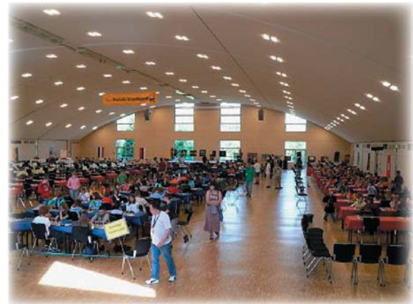
Der wahrscheinlich leiseste Turniersaal der Welt