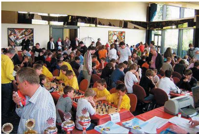
Foto vom 1. offenen Deutschen Schulschach CUP 2005 im Sauerlandsternhotel Willingen

31 Mannschaften aus Hessen, NRW und Sachsen-Anhalt haben sich für dieses Turnier angemeldet. Das Besondere: Die Mannschaften spielen mit jeweils acht Personen. In der Gruppe der weiterführenden Schulen müssen die Spieler aus unterschiedlichen Wettkampfklassen spielen. In jeder Mannschaft müssen also Jüngere und Ältere zusammenspielen. Daneben gibt es noch die zweite Gruppe der Grundschulen, in der die Anmeldezahlen noch etwas höher sind.