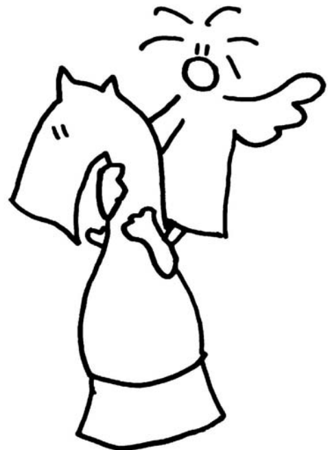
Malt mich aus!