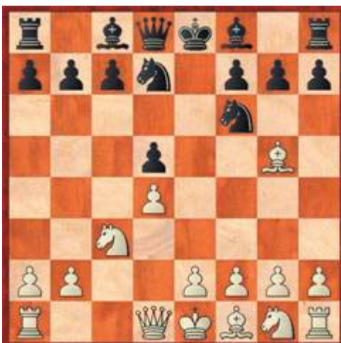
Brett 2 in der U16

1.De4 Tb8 2.Dxb7+ Txb7 3.Tc8+ Tb8 4.Txb8# ohne Worte