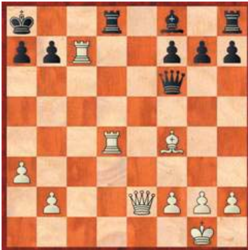
Brett 2 in der U10

6.Sxd5?? 6...Sxd5 Wir unterscheiden echte Fesselung ( dahinter steht der König ) und unechte Fesselungen. Die „gefesselte“ Figur zieht einfach trotzdem! 7.Lxd8 Lb4+ 8.Dd2 Lxd2+ 9.Kxd2 Kxd8 und Schwarz gewinnt 0-1