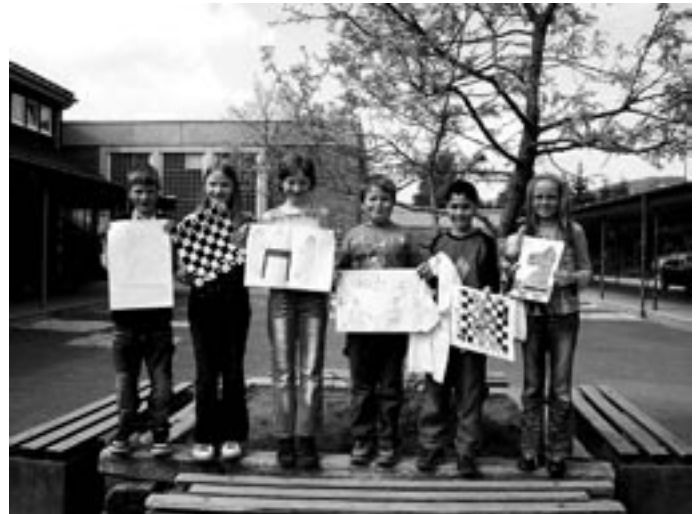
Die fröhlichen Sieger des Malwettbewerbs aus Willingen