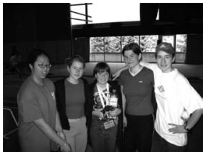
Eines der beiden erfolgreichen sächsischen Teams. Immerhin zehn Punkte für die Länderwertung und damit der Sprung an die Tabellenspitze!