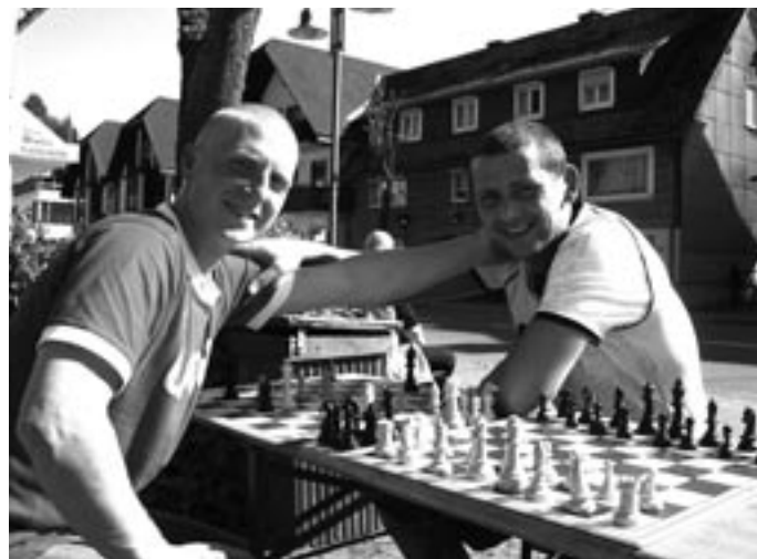
Und Schach verbindet.

Kennt ihr das: Ihr spaziert mir-nichts dir-nichts durch die Willinger Innenstadt, um euch die Langeweile zu vertreiben. Zumindest für diejenigen Willinger, die bis Mittwoch nichts anderes zu tun haben sollten ist jetzt Schluss mit Langeweile: